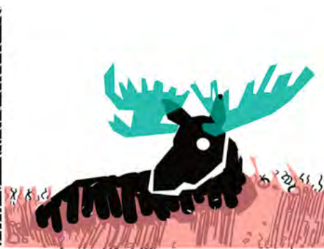
OSTAVI NA MENI DA NADEM NAČIN DA BUDEM.