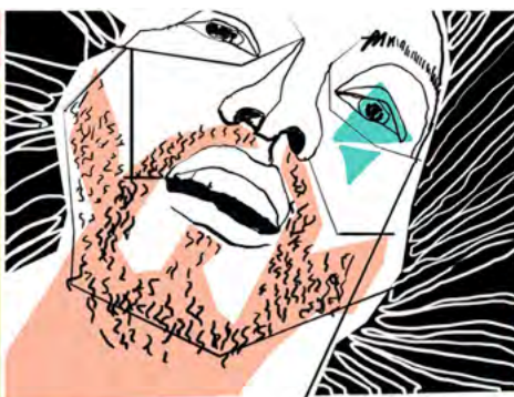
VELIKO SUNCE SIJA NAD VELIKIM LJUDIMA U VELIKOM SVETU.