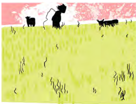
UZDIĆI ĆU SE. ZAPALICU CRNE RUPE U TAMNIM SEĆANJIMA.

Посао не чини човека, али посао који волиш доприноси твојој срећи. Само, где год да си тренутно покушај да на крају, када одатле одеш, понесеш са собом само лепа искуства и што више знања и умећа, преносећи искуства и своја сазнања. То је некако мој савет, од младе особе другој младој особи. Шири даље.